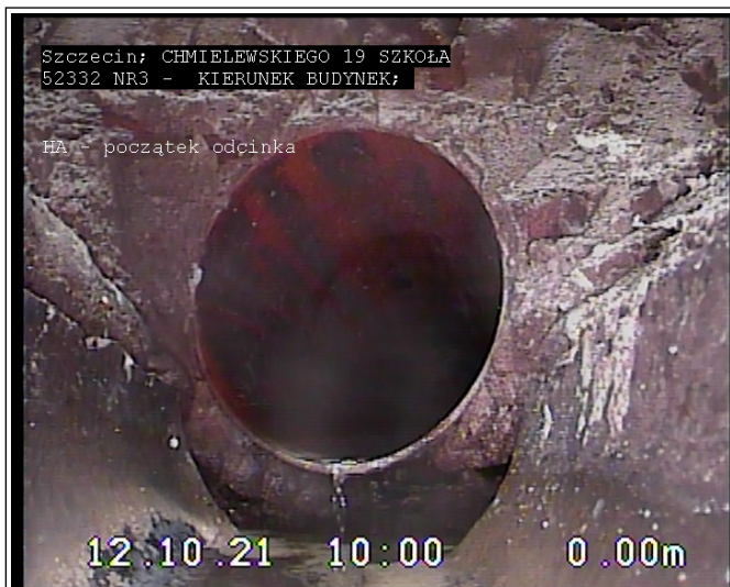
(1) 0.00 m - HA - początek odcinka BRAK POŁĄCZENIA PRZYKANALIKA W STUDNI WDNIE