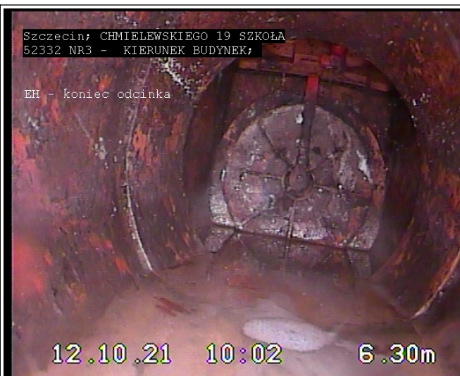
(2) 6.30 m - EH - koniec odcinka